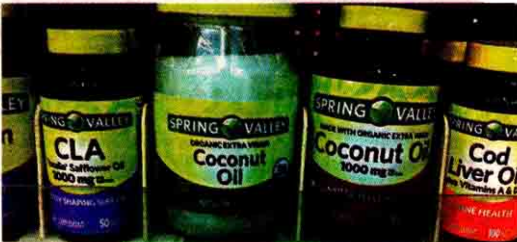
അമേരിക്കയിലെ സൂപ്പർ മാർക്കറ്റുകളിൽ വിലപനയ്ക്കു വച്ചിരിക്കുന്ന വെളിച്ചെണ്ണയും വെളിച്ചെണ്ണ ജെൽ ക്യാപ്സ്യൂളും. അമേരിക്കയിൽ നിന്ന് പകർത്തിയ ചിത്രങ്ങൾ.

ന്തോനേഷ്യൻ കമ്പനിയായ big tree farms എന്നിവർ ഇതിന് ഉദാഹരണങ്ങളാണ്. ഇവരുടെ വെബ്സൈറ്റുകളിൽ നാളികേരത്തിന്റെ ആരോഗ്യ, ഔഷധമൂല്യങ്ങളെക്കുറിച്ച് വ്യക്തമായ പഠന റിപ്പോർട്ടുകളും നൽകിയിരിക്കുന്നു.